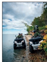
На 4-й стр. обложки В дозоре на квадроциклах.