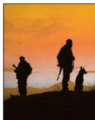
На обложке На горных вершинах.

56 ПОЭЗИЯ Владимир Силкин Всепогодная служба Стихи